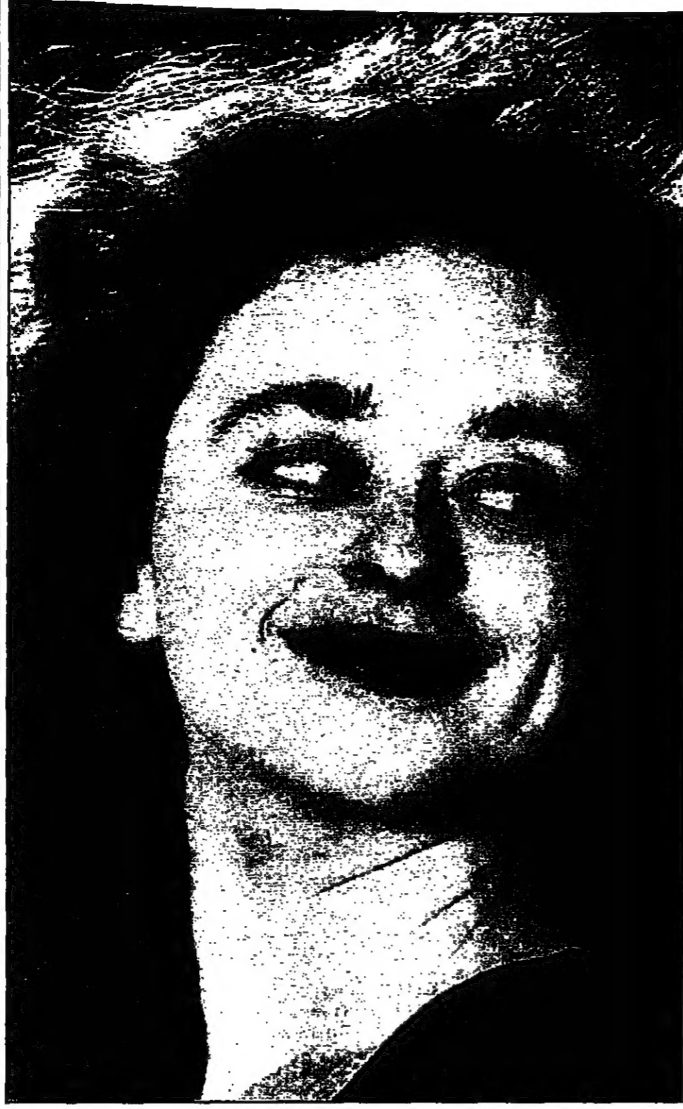
الذخانة ناعما صوالحة ابنه لائل وللرج العربي اللقي في بريطانيا تقيم صوالحة طبع هذه الأيام على شاشة التلفزيون البريطاني في نور آني وسمل دليست الممثلة الشهيرة على قناة دبي بي سي، الأولى.